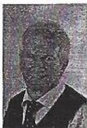
Schirmherr: Franz Robeller 1. Bürgermeister